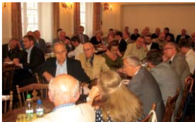
Forum Myśli Strategicznej pt. „Mocarstwa XXI wieku. Przyczynek do studiów geostrategicznych” w Domu Ekonomisty PTE.