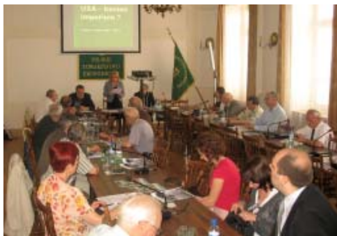
XVI Konwersatorium z cyklu „Czwartki u Ekonomistów” pt. Imperium amerykańskie – perspektywy gospodarki i dolara” w Domu Ekonomisty PTE.