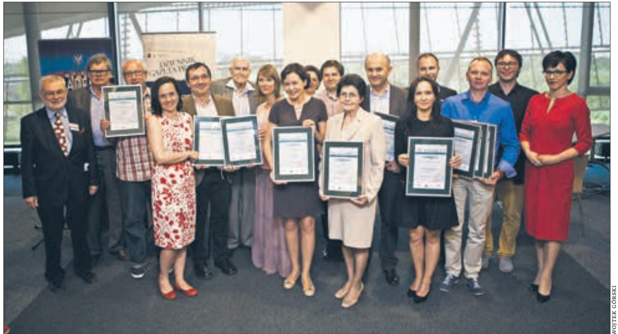
Wyróżniliśmy 14 tytułów, które ukazały się na rynku w ciągu minionego roku