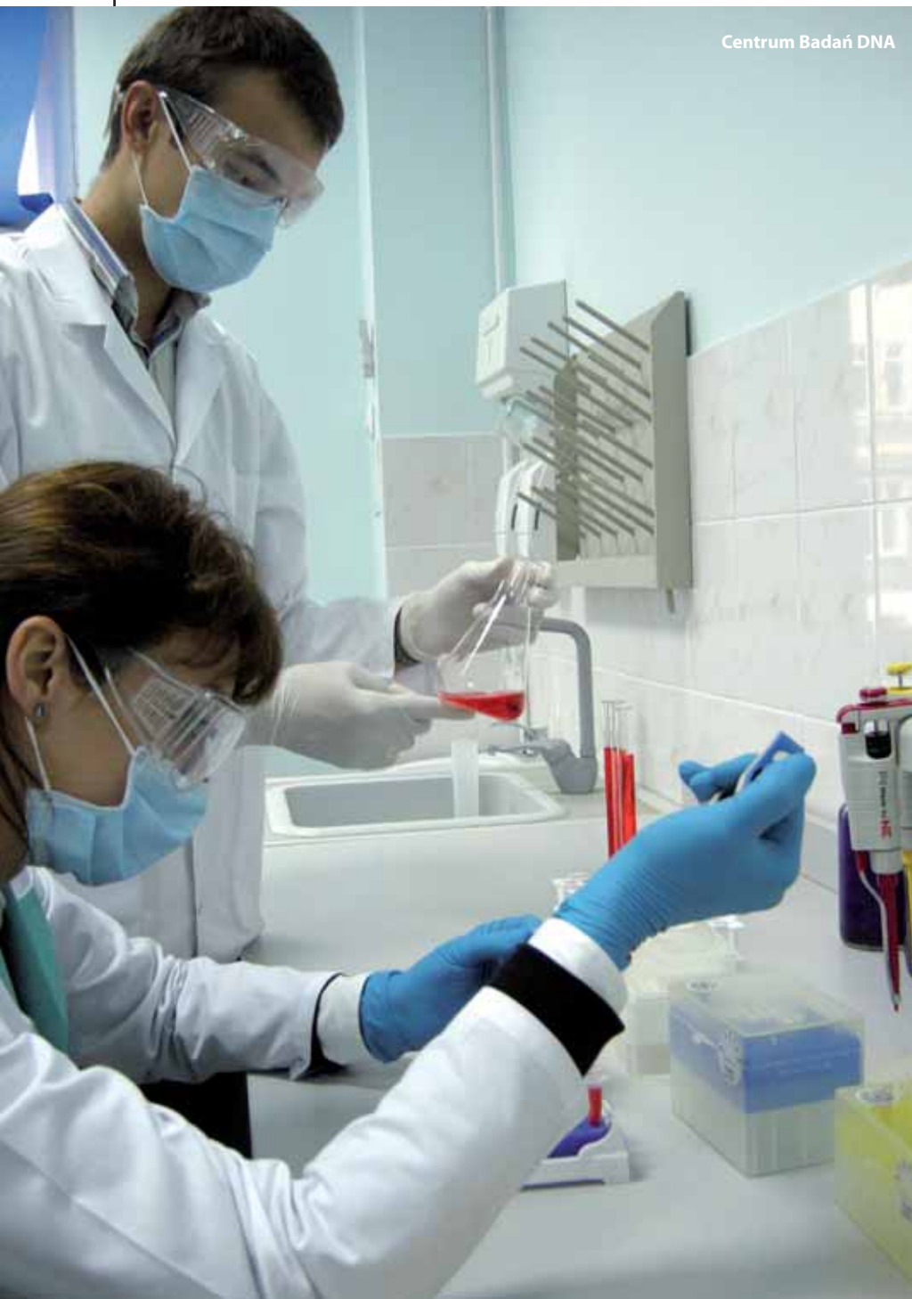
Centrum Badań DNA

Po co firmom regionalna strategia innowacji (RSI)? Niewielu przedsiębiorców przegląda takie dokumenty. Nie jest to lektura, bez której działalność firmy może być zagrożona. To raczej biblia dla tych, którzy mają wpływ na politykę regionalną.