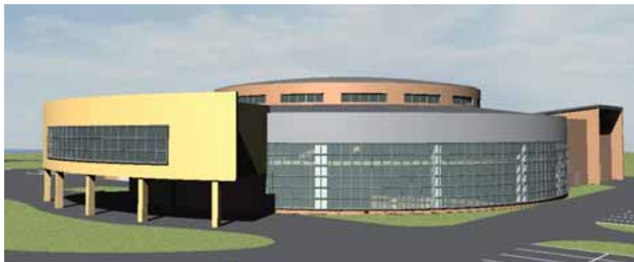
Wizualizacja Centrum Wykładowo-Dydaktycznego w Koninie.

3 listopada podpisano pre-umowę na realizację zadania Rewaloryzacja Wzgórza Lecha w Gnieźnie . Koszt projektu to 3 870 000 euro , a poziom dofinansowania z UE wynosi 70%. Zadanie to będzie realizować w latach 2009-2012 Archidiecezja Gnieźnieńska.