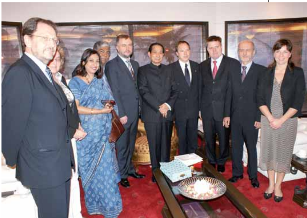
W rezydencji gubernatora stanu Maharashtra

I Wielkopolska, i region Maharashtra mają silną pozycję w swoich krajach, znaczący